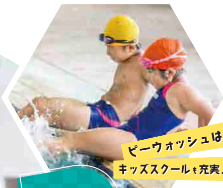
ピーウォッシュは キッズスクールも充実！